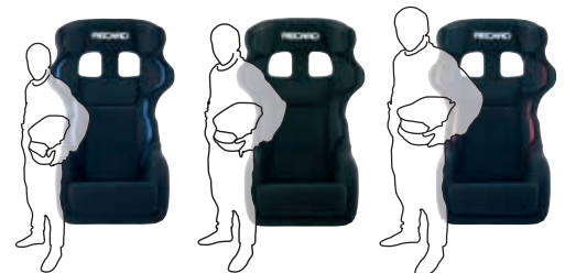
Pad-Kit S, M, L